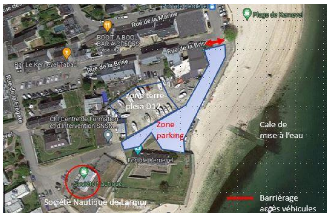
Site du fort de Kernevel : Mise à l'eau et parking Dinghy 12