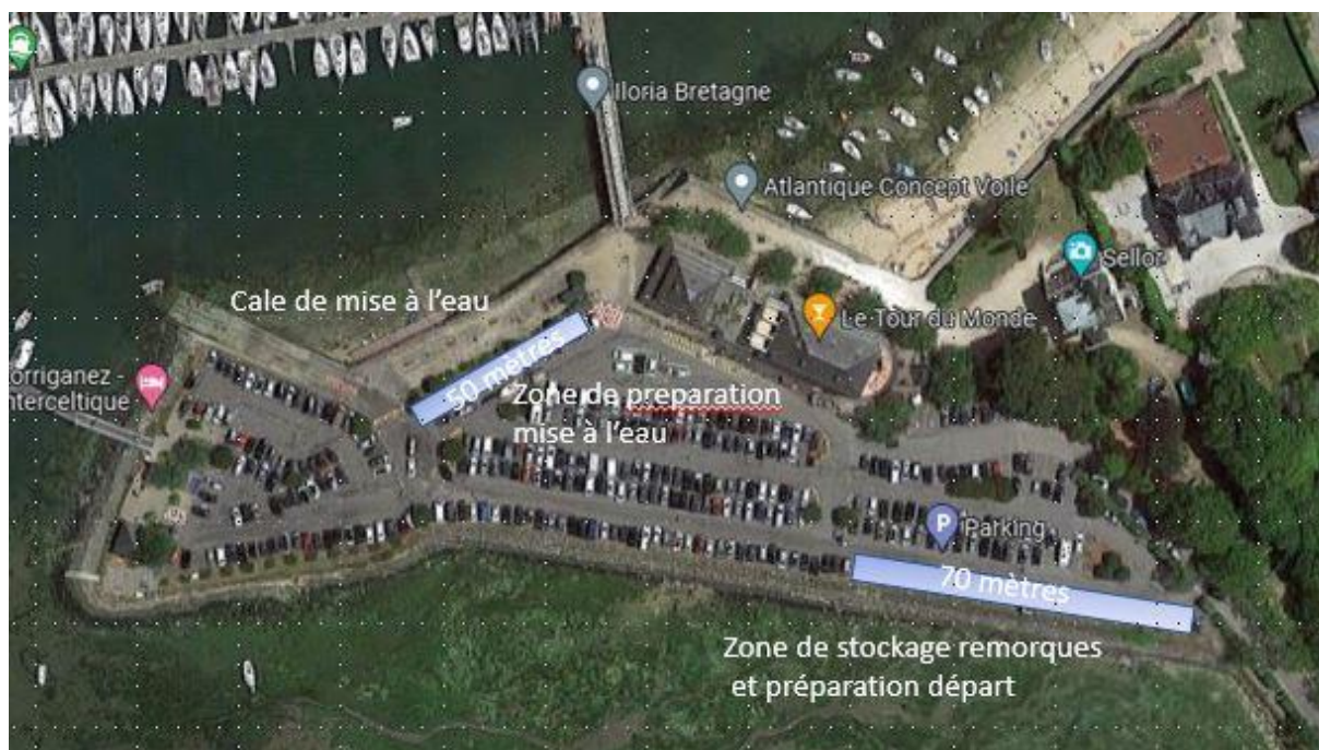
Site du port de Kernevel : mise à l'eau Caravelles, Belouga, mini J, Hansa, Neo,...