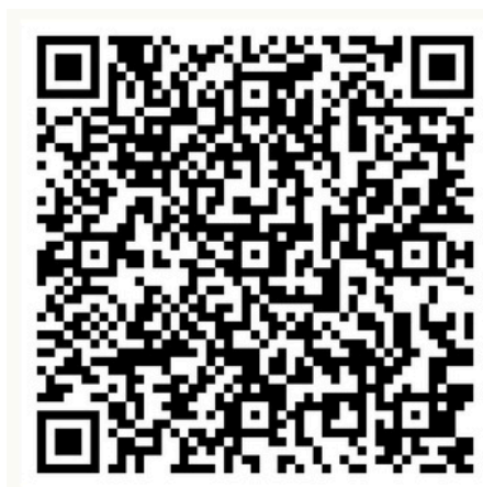
Photos & Vidéos de l'édition 2025

L'Atlantique Le Télégramme E.Leclerc reflète toute la vitalité du nautisme à Lorient . Portée par le Centre Nautique de Lorient, cette régata incarne à la fois la passion sportive et l' ancrage territorial .